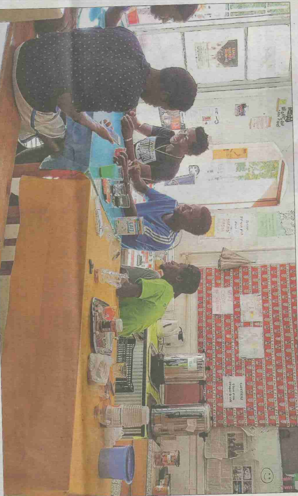
Le refuge accueille toujours de nouveau arrivants. Sept vendredi, dont plusieurs blessés.